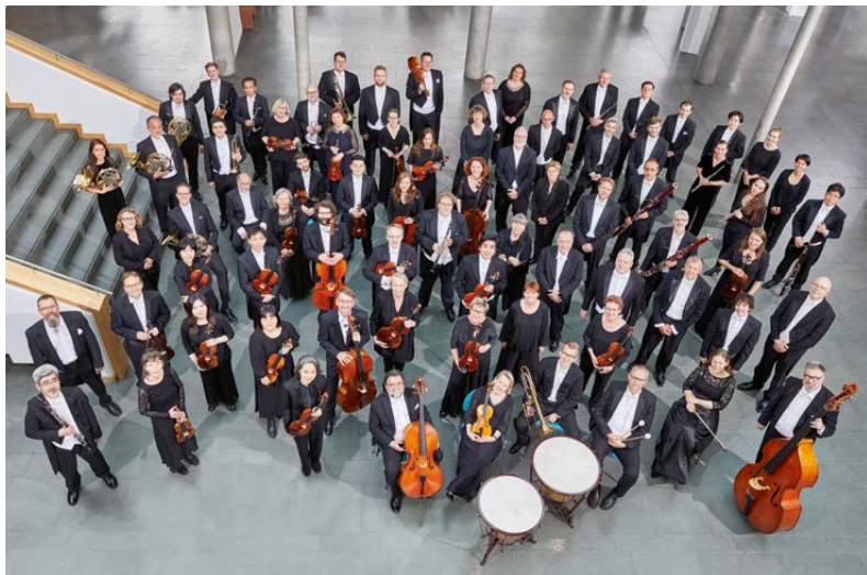
Brandenburgisches Staatsorchester Frankfurt