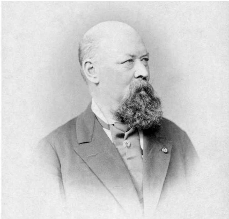
Franz von Suppè