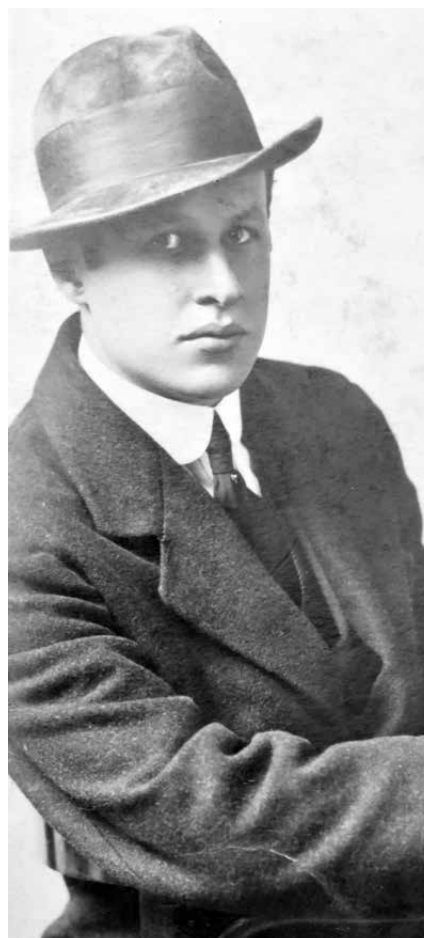
Sir Eugene Goossens