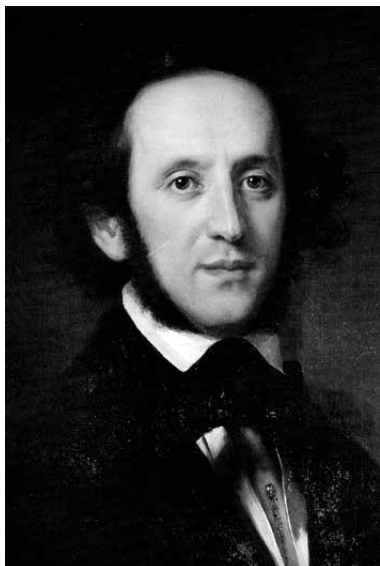
Felix Mendelssohn Bartholdy