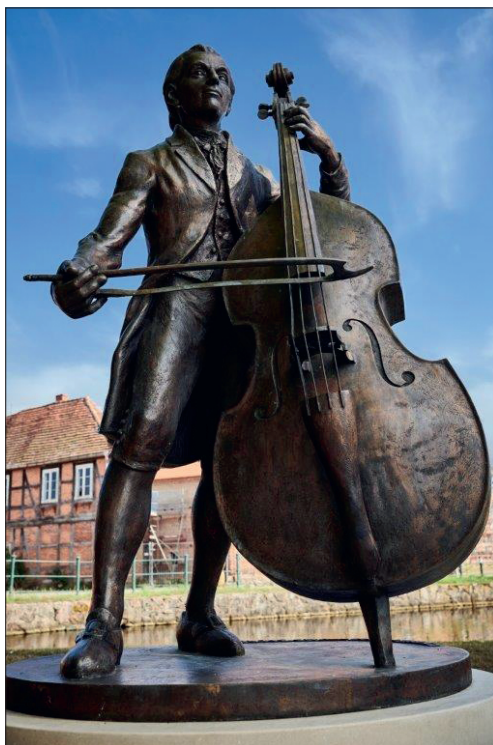
Leopold van der Pals, Bronze-Denkmal Bronze-Denkmal, Bildhauer: Andreas Krämer