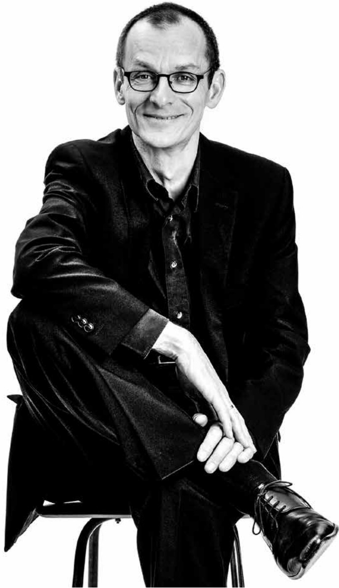
Christoph Starke © Beate Wätzel