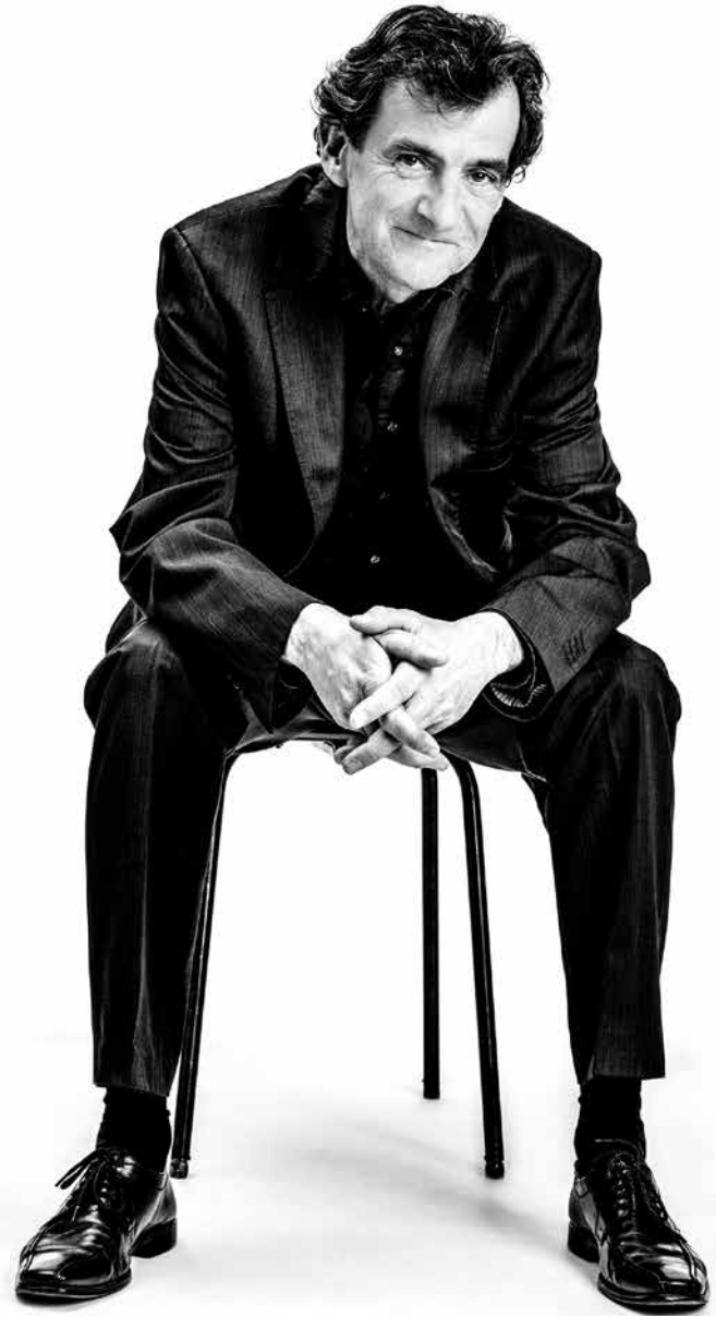
Jan-Peter Kuschel © Beate Wätzel