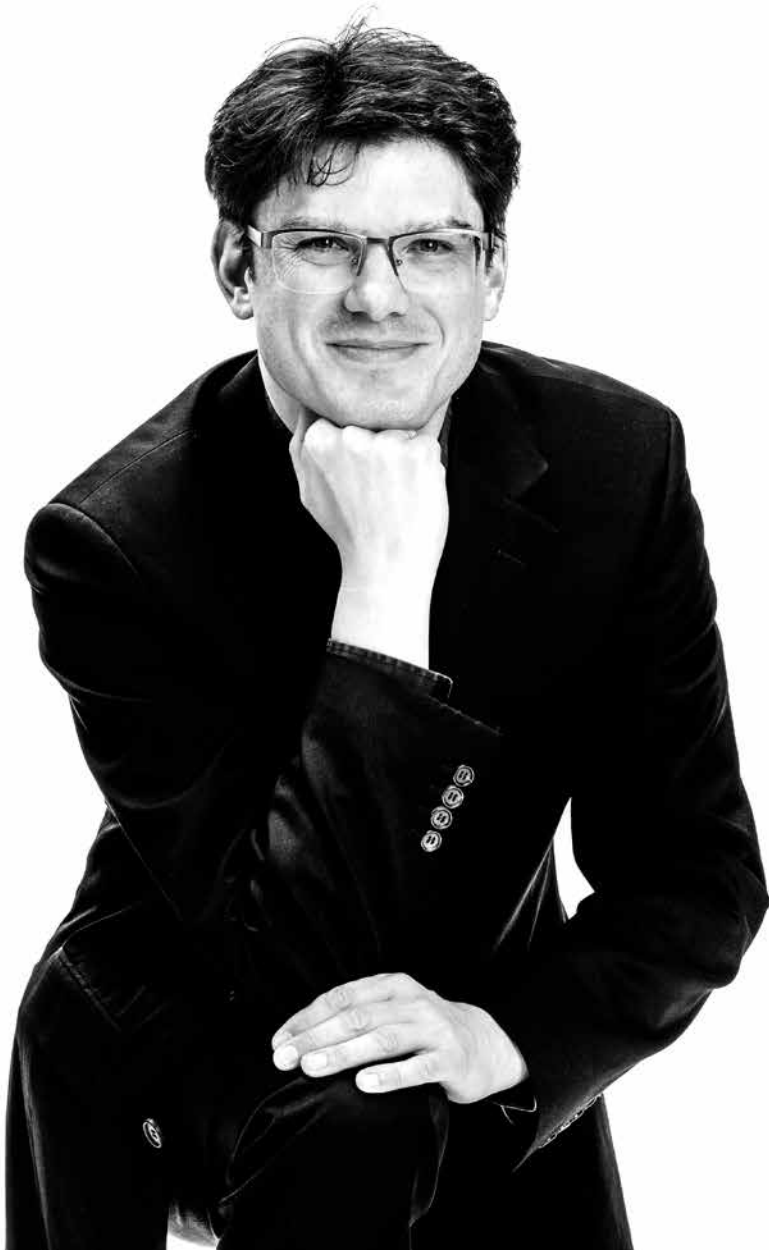
Peter Rainer