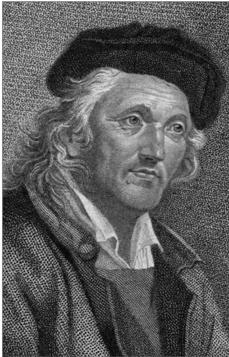
Selbst-Porträt Kirnberger 1740