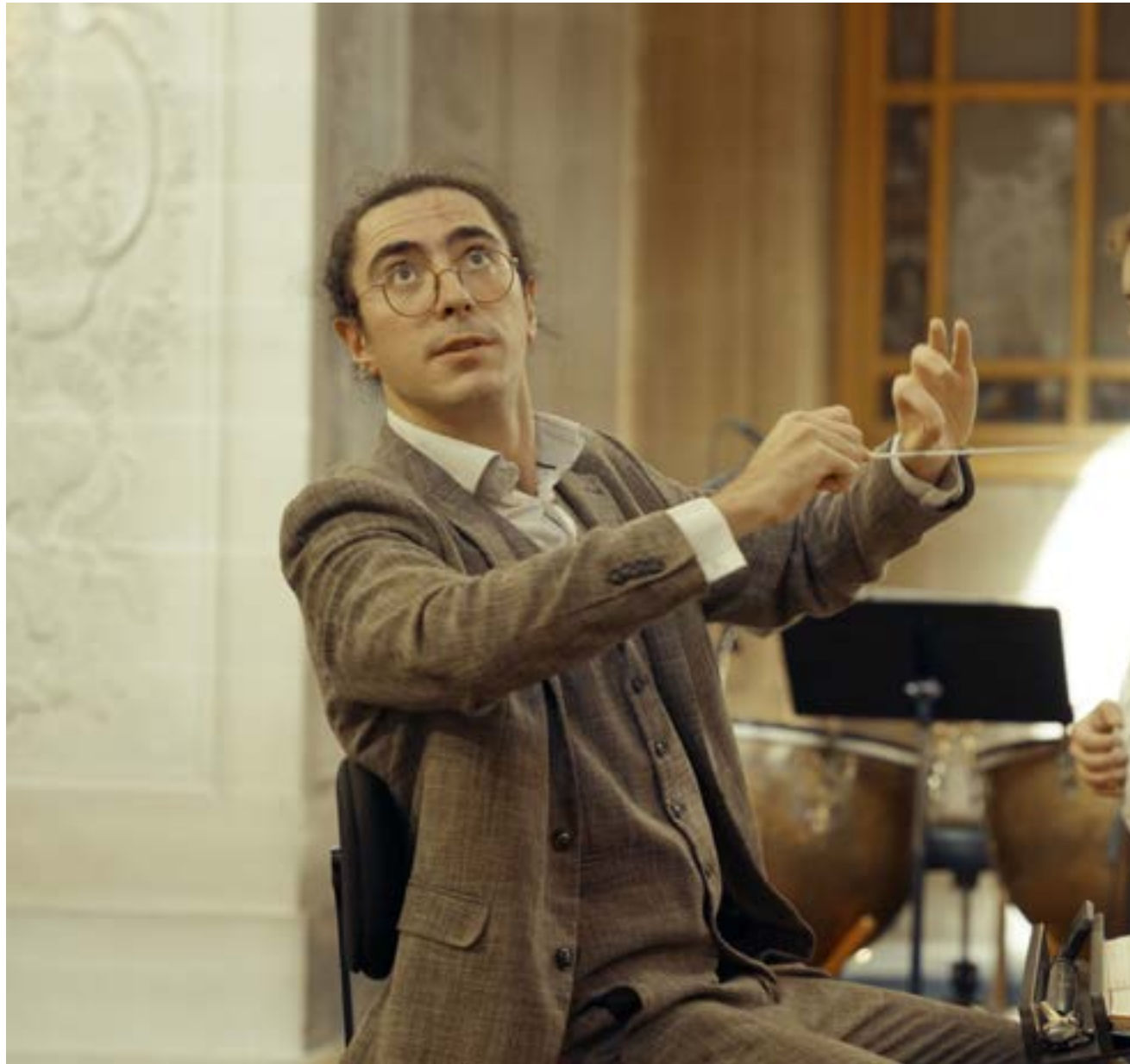
Jean-Baptiste Nicolas, Chapelle Royale du Château de Versailles, 2023