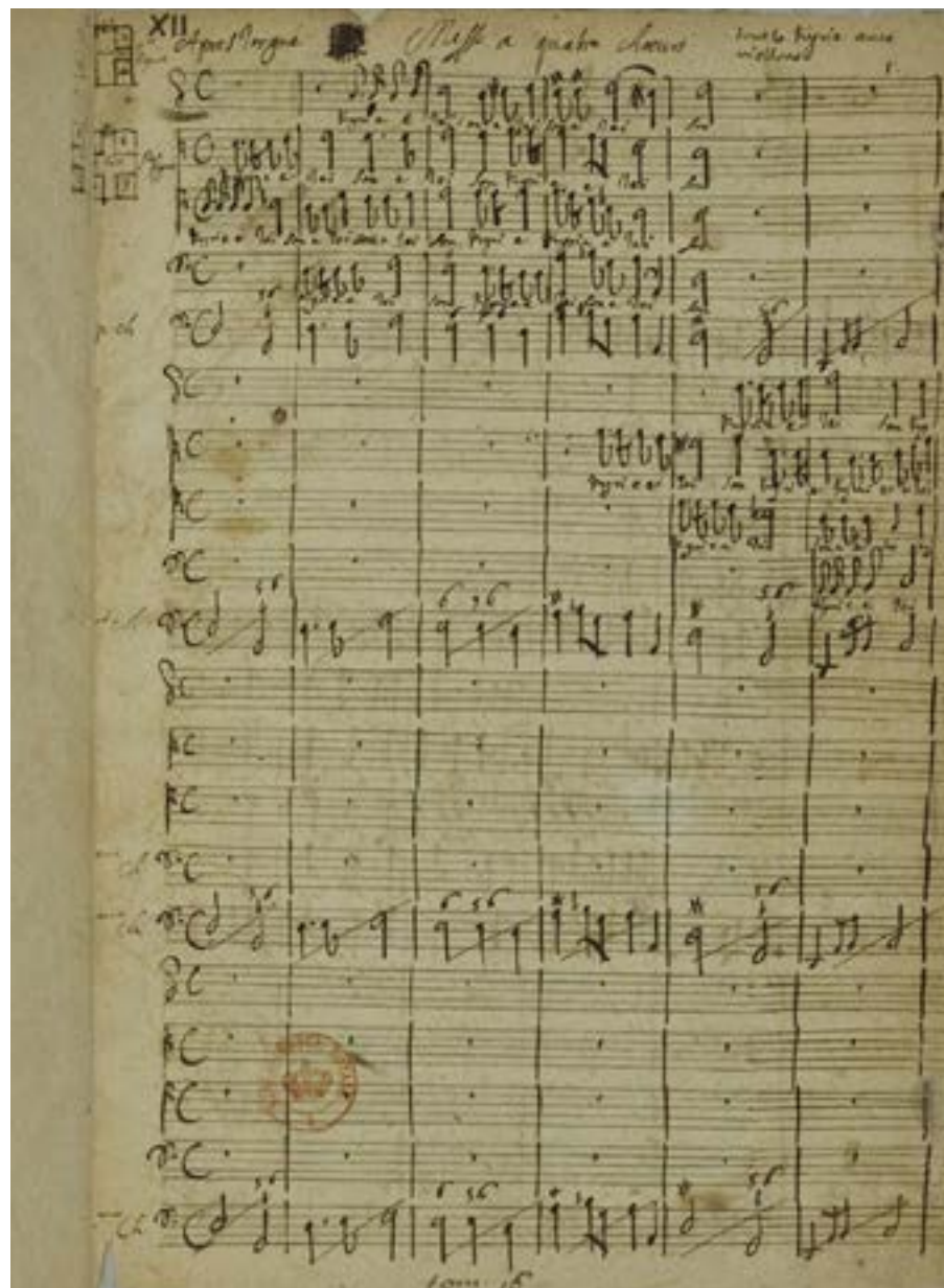
Manuscrit autographe de la Messe à quatre choeurs, Marc-Antoine Charpentier, ca 1670