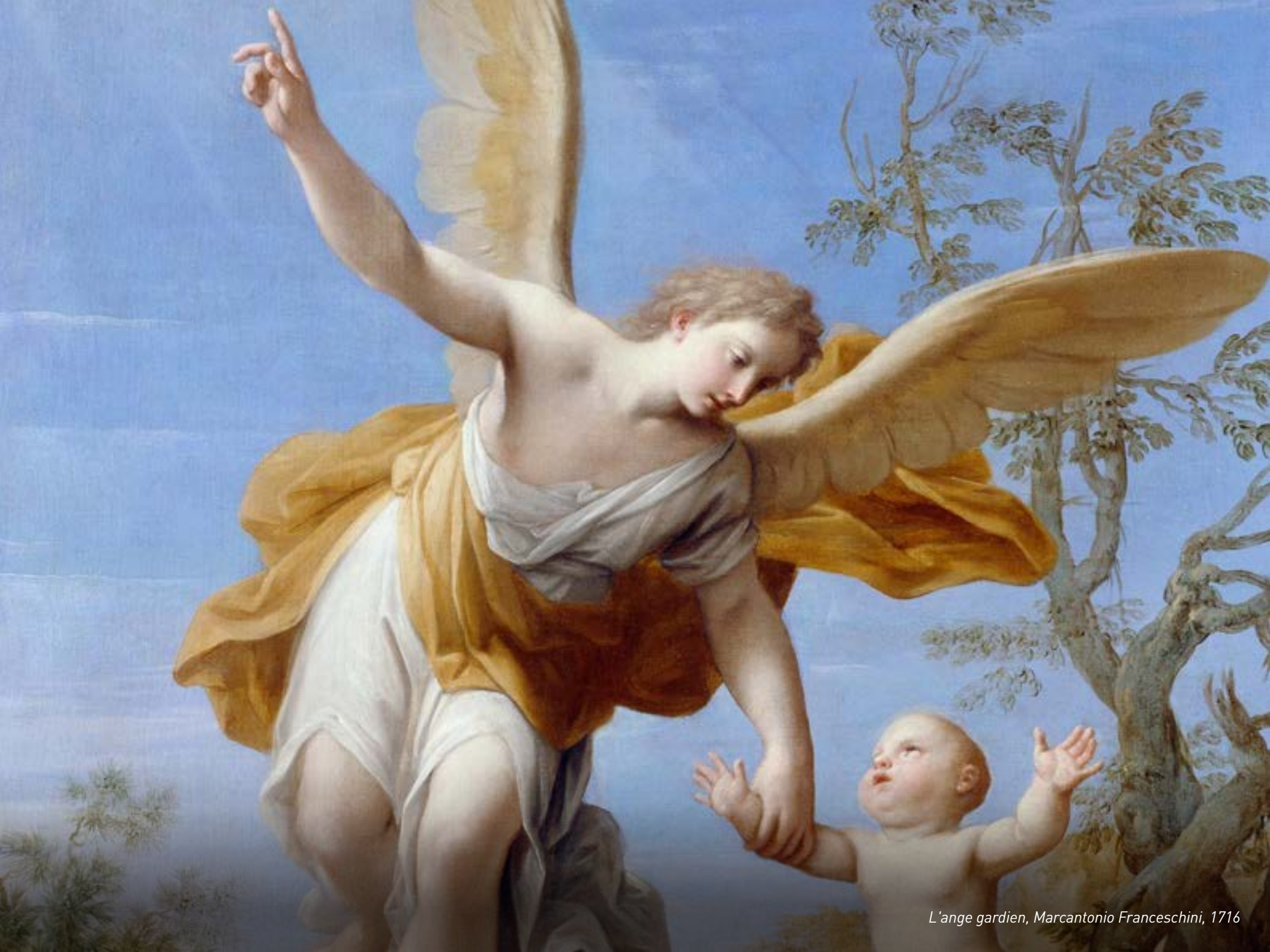
L'ange gardien, Marcantonio Franceschini, 1716