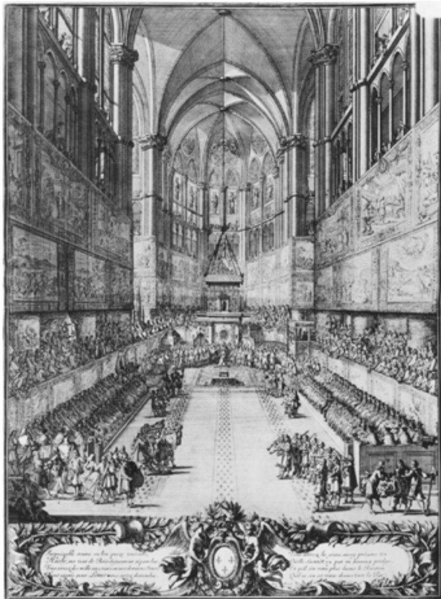
Le Sacre de Louis XIV, le 7 juin 1654, dans la cathédrale de Reims, Jean Lepautre, XVII e siècle