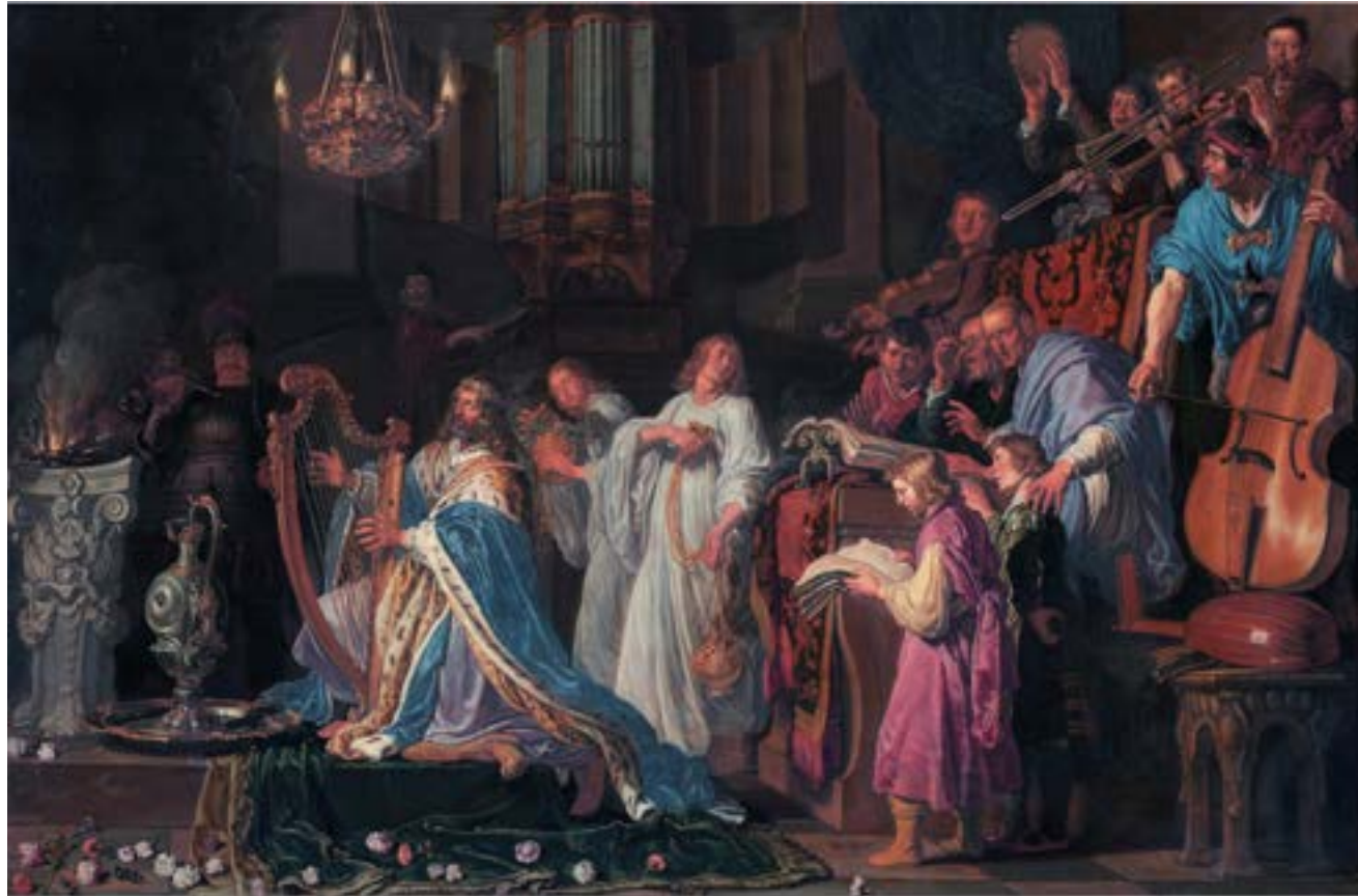
David au temple, Pieter Lastman, 1618