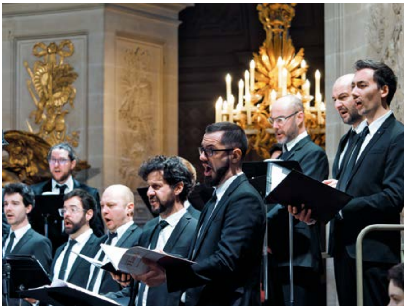
Chœur de l'Opéra Royal