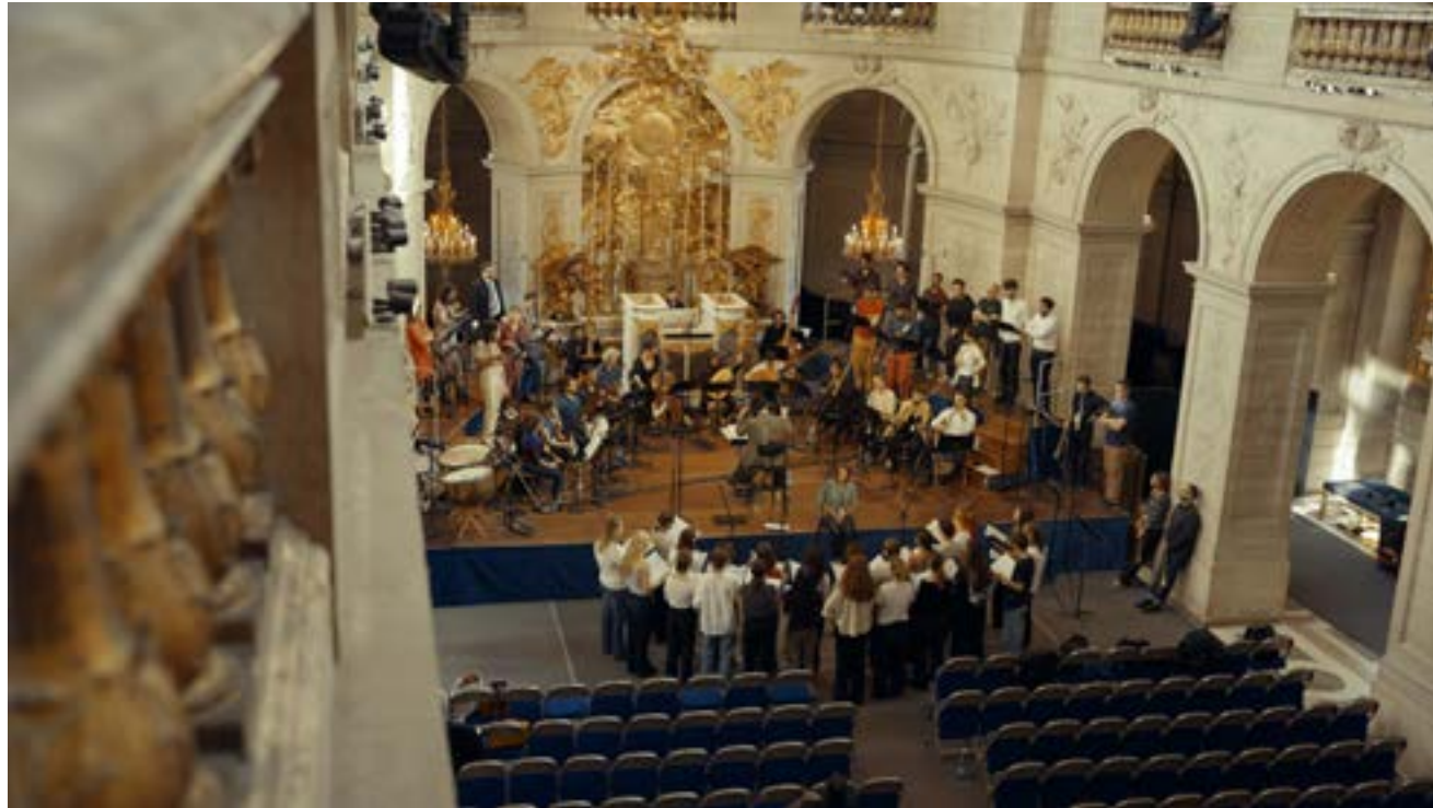
Le Consort Musica Vera, Chapelle Royale du Château de Versailles, 2023