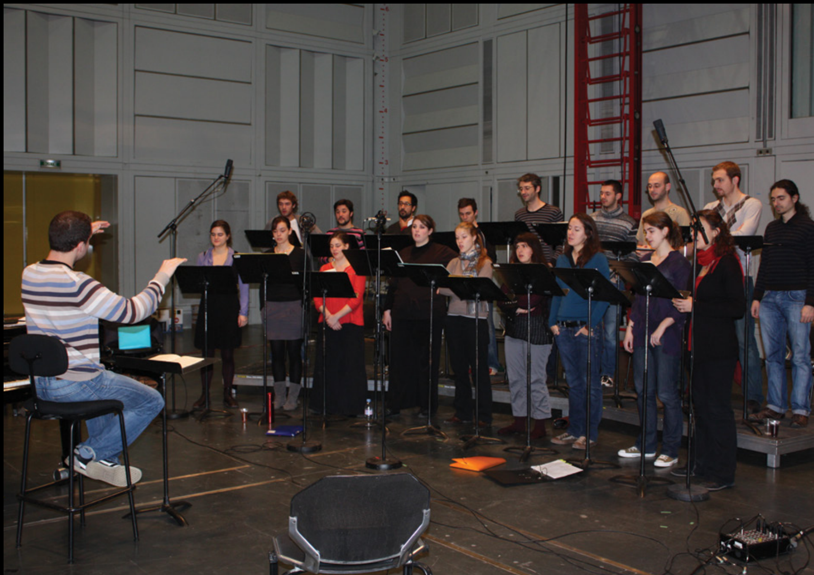
Enregistrement d' Un soir de neige de Francis Poulenc, IRCAM (Paris), 2009