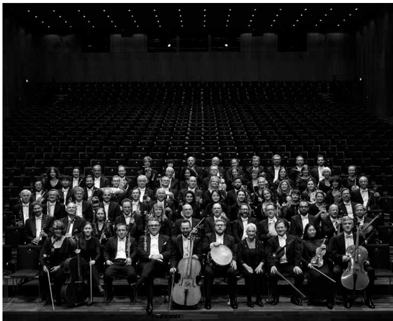
Württembergische Philharmonie Reutlingen