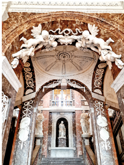
Schloss Drottningholm