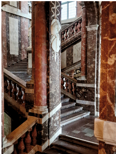
Schloss Drottningholm