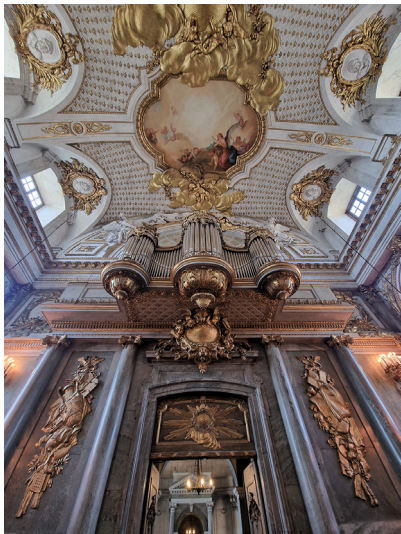
Königliches Schloß Stockholm, Schloßkirche