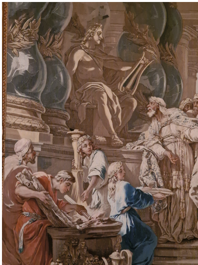
Schloss Drottningholm