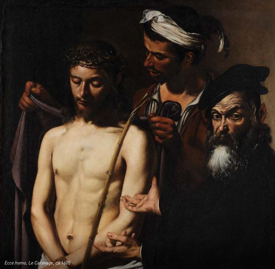
Ecce homo, Le Caravage, ca 1605