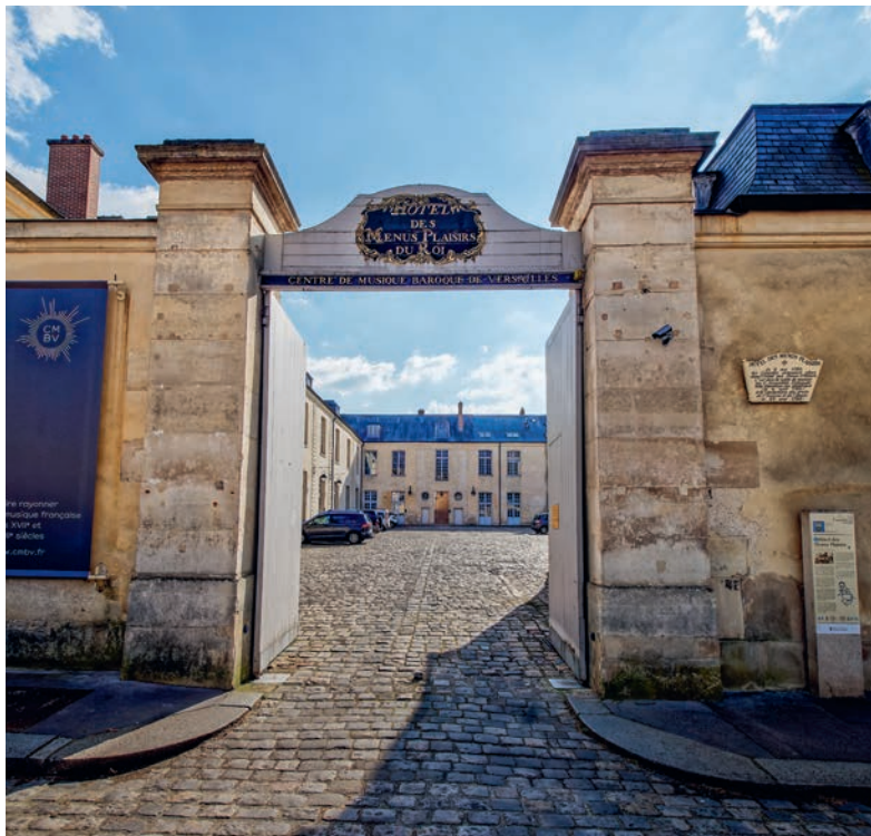
Le Centre de musique baroque de Versailles