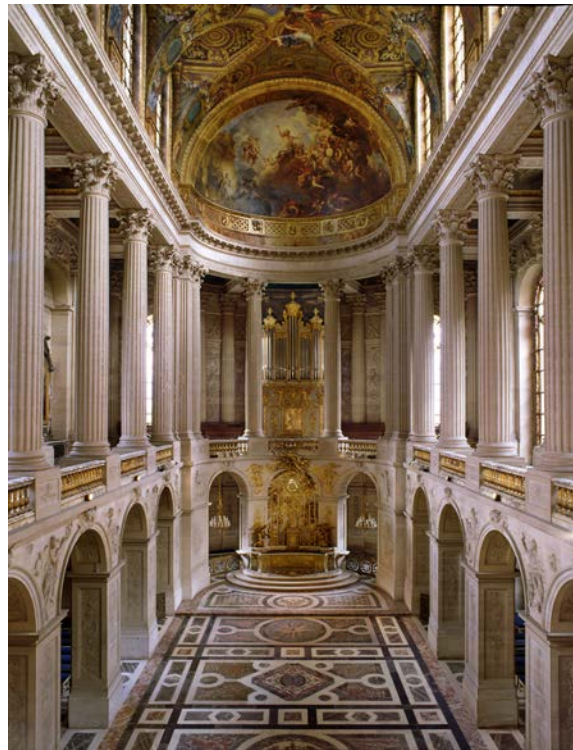
La Chapelle Royale de Versailles