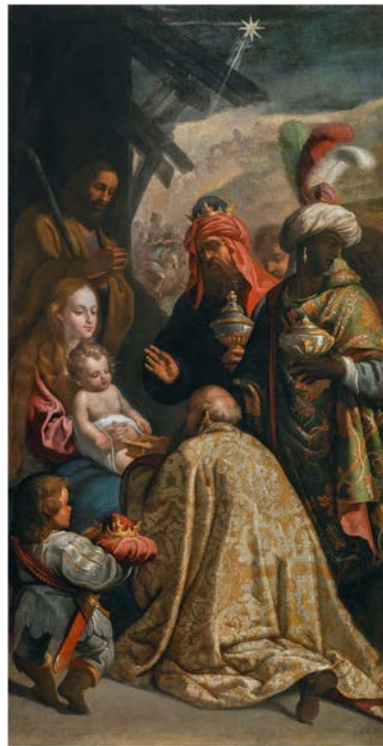
Adoration des Mages, Eugenio Cajés, ca 1625

The Centre de musique baroque de Versailles is supported by the Ministry of Culture (Direction générale de la création artistique), the Etablissement public du château, du musée et du domaine national de Versailles, the Conseil régional d’Île-de-France, the Ville de Versailles, the CMBV’s corporate sponsors, the Cercle Rameau and the CMBV Endowment Fund.