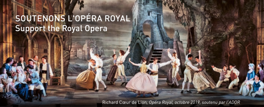
Richard Cœur de Lion, Opéra Royal, octobre 2019, soutenu par L'ADOR

Château de Versailles Spectacles, filiale privée du Château de Versailles, a pour mission de perpétuer le foisonnement musical et artistique qui fait rayonner la résidence royale dans le monde entier. Elle produit la saison musicale de l'Opéra Royal, soit près d'une centaine de représentations par an à l'Opéra Royal et à la Chapelle Royale, des concerts d'exception au Salon d'Hercule et dans la Galerie des Glaces ainsi que les grands spectacles de plein air à l'Orangerie. Elle ne reçoit aucune subvention publique. Ses recettes de billetterie et le soutien de donateurs privés et d'entreprises mécènes lui permettent de construire une saison riche qui réunit plus de 50 000 spectateurs par an.