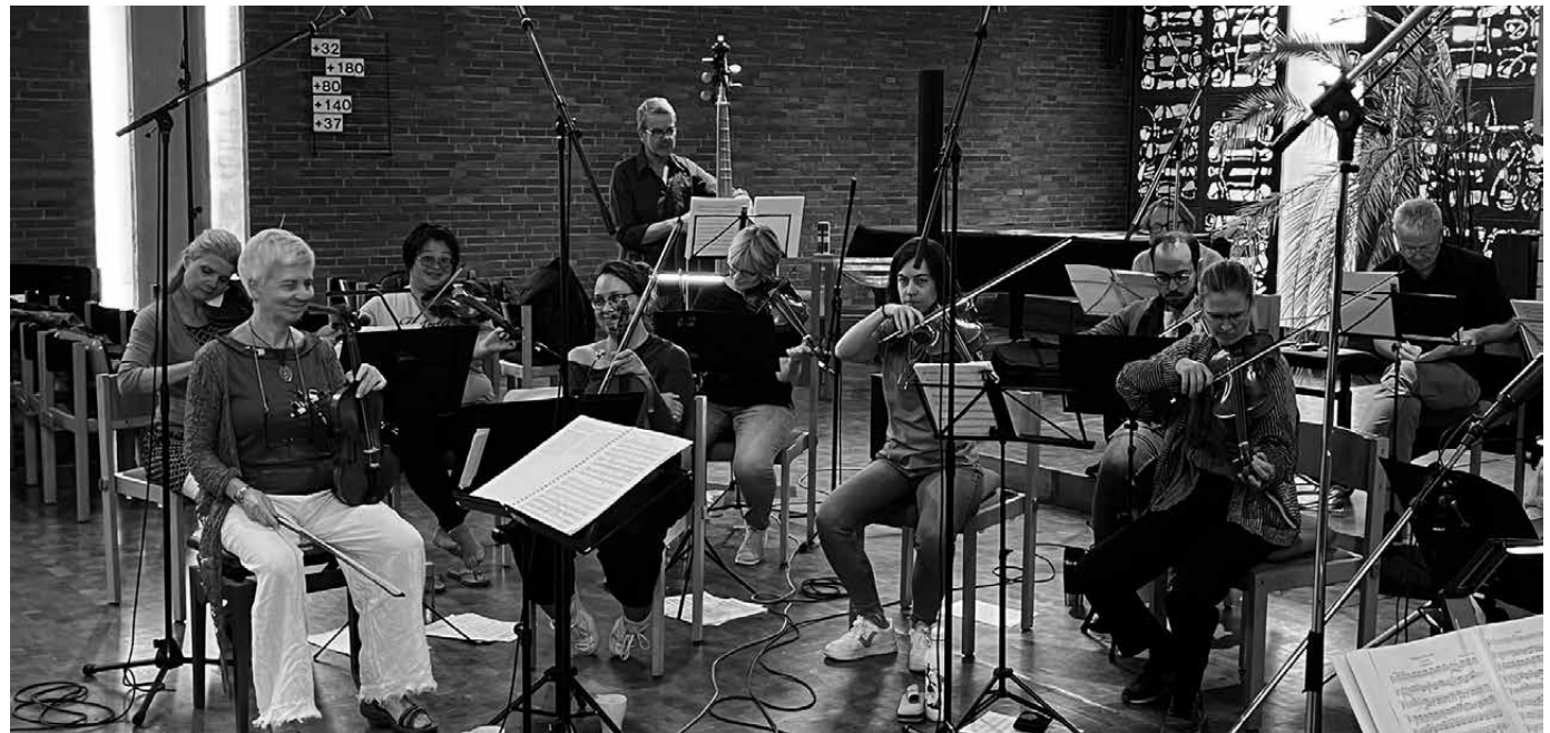
La Stagione Frankfurt during a recording session

Im Jahr 2000 wurde ihm der Telemann-Preis der Stadt Magdeburg für seine Verdienste um das Werk dieses Komponisten verliehen.