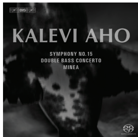
BIS-1866 · Symphony No. 15 (+ Double Bass Concerto, Minea)

These and other recordings from BIS are also available as high-quality downloads from eClassical.com