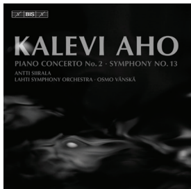
BIS-1316 · Symphony No. 13 (+ Piano Concerto No. 2)