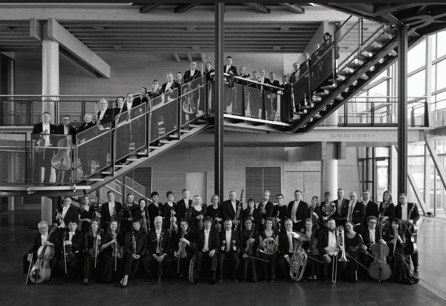
Lahti Symphony Orchestra