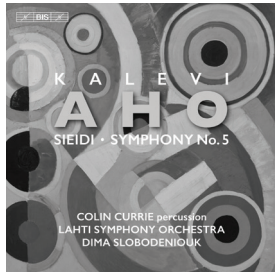
BIS-2336 · Symphony No. 5 (+ Sieidi)