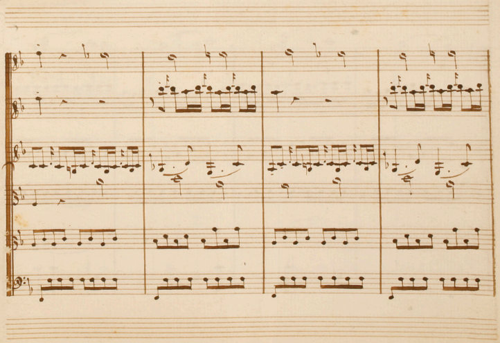
Sestetto II, L274 (copy of the original manuscript) Fondo Borbone of the Palatine Library of Parma