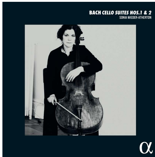
CD ALPHA 1053 / LP ALPHA 599