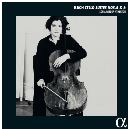
CD ALPHA 1076 / LP ALPHA 1077