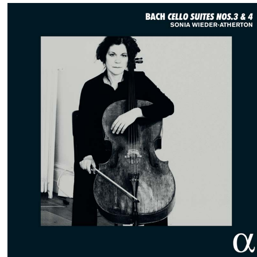
CD ALPHA 1009 / LP ALPHA 1003