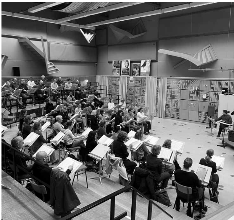
Groot Omroepkoor rehearsing for "Der Kreis des Lebens", Studio 4, Heuvellaan, Hilversum