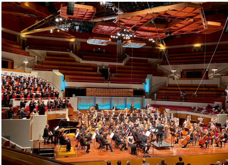
"Der Kreis des Lebens" at the Concert, 20. January 2023, Grote Zaal TivoliVredenburg cpo 555 648-2