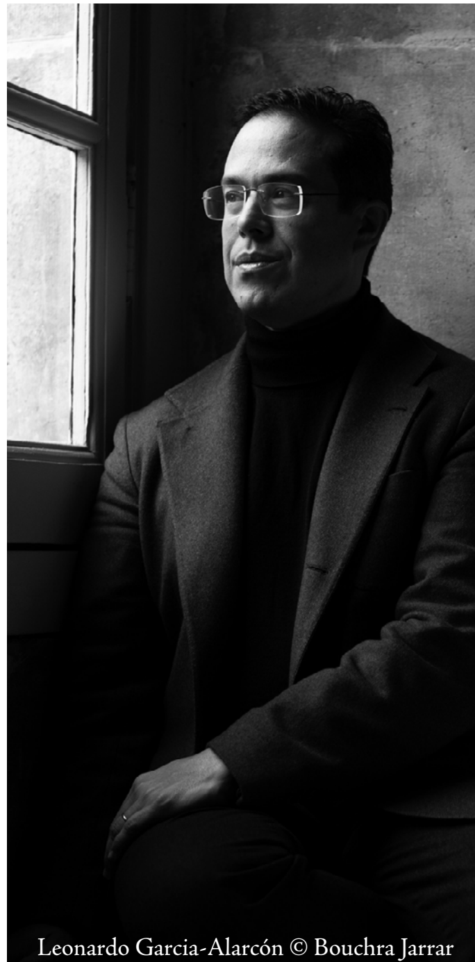
Leonardo Garcia-Alarcón © Bouchra Jarrar