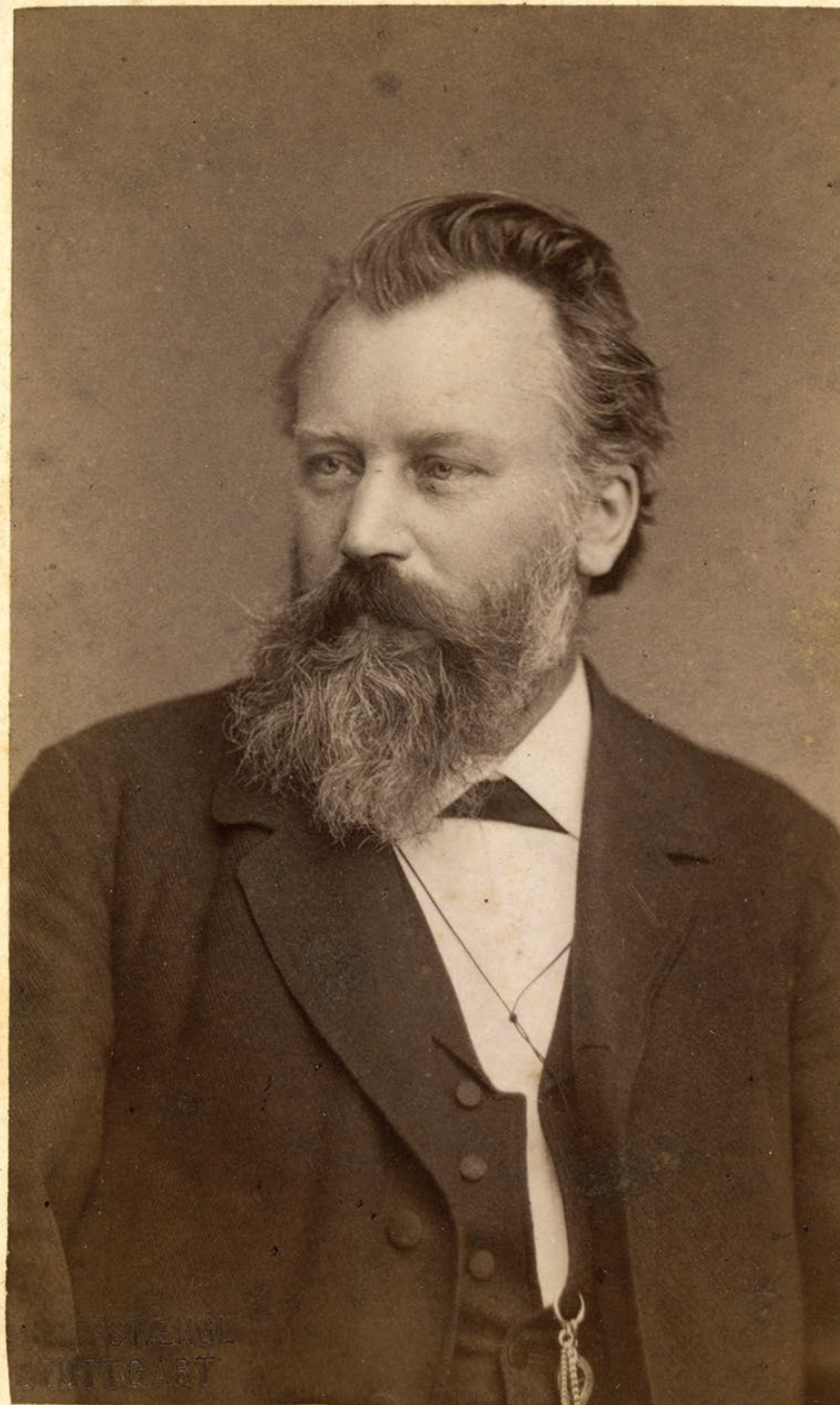
Johannes Brahm 1878