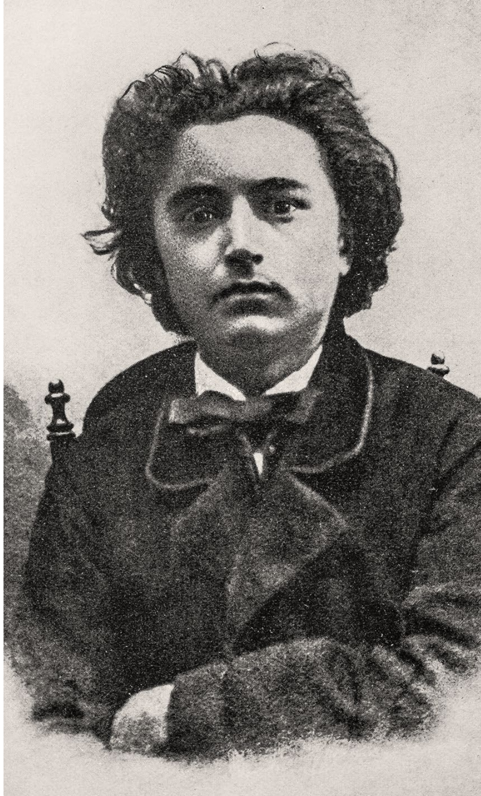
Robert Fuchs, um 1864