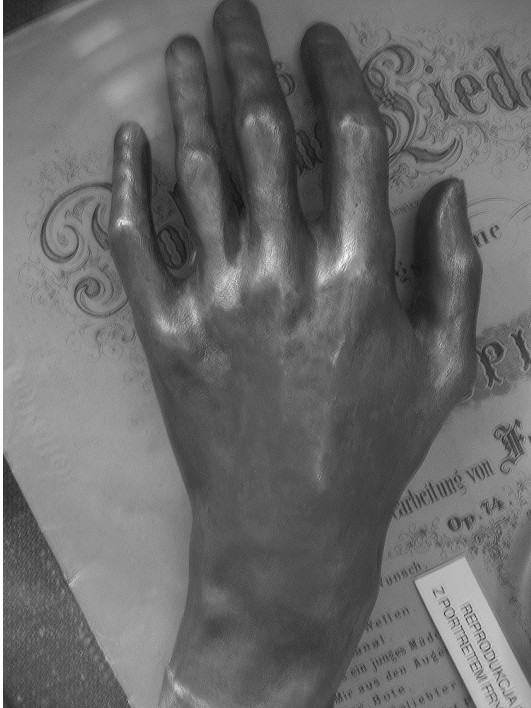
Chopin's hand. Postmortem cast at Polish Museum, Rapperswil