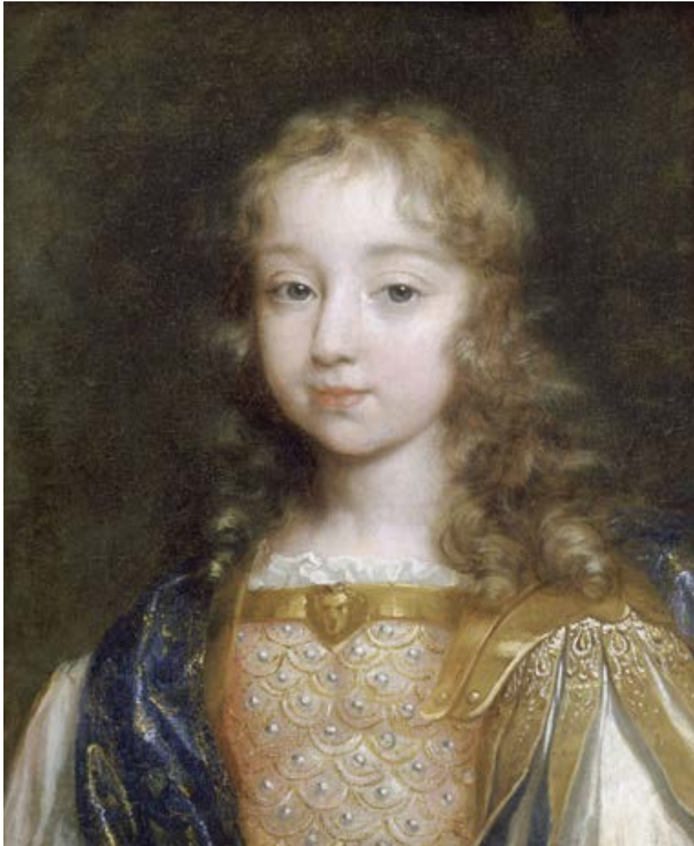
Portrait présumé de Louis XIV enfant, Louis El le Père, ca 1645