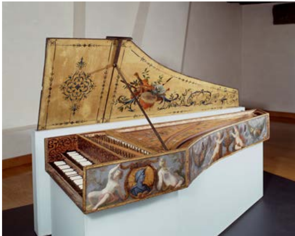
Clavecin Jean II Denis Issoudun

de ballets contribuent à façonner un style français identifiable et apprécié au-delà des frontières, et à pérenniser le goût des amateurs de musique pour « l'instrument de tous le plus parfait 19 ».