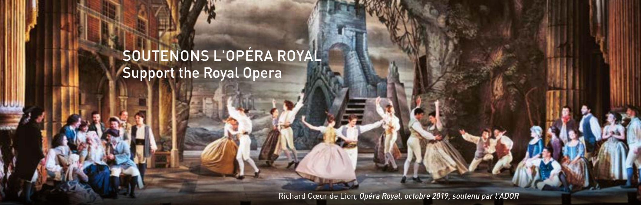
Richard Cœur de Lion, Opéra Royal, octobre 2019, soutenu par l'ADOR

Château de Versailles Spectacles, filiale privée du Château de Versailles, a pour mission de perpétuer le foisonnement musical et artistique qui fait rayonner la résidence royale dans le monde entier. Elle produit la saison musicale de l'Opéra Royal, soit près d'une centaine de représentations par an à l'Opéra Royal et à la Chapelle Royale, des concerts d'exception au Salon d'Hercule et dans la Galerie des Glaces ainsi que les grands spectacles de plein air à l'Orangerie. Elle ne reçoit aucune subvention publique. Ses recettes de billetterie et le soutien de donateurs privés et d'entreprises mécènes lui permettent de construire une saison riche qui réunit plus de 50 000 spectateurs par an.