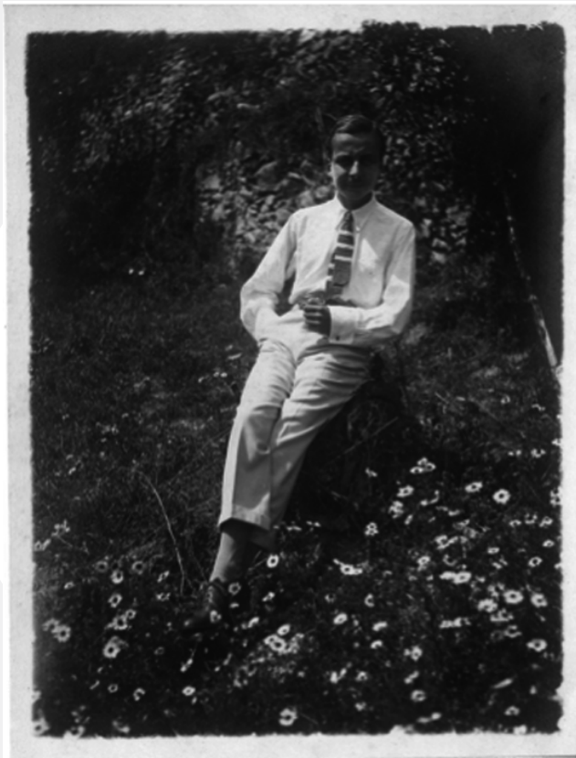
Ritratto di Giacinto Scelsi, agosto 1924