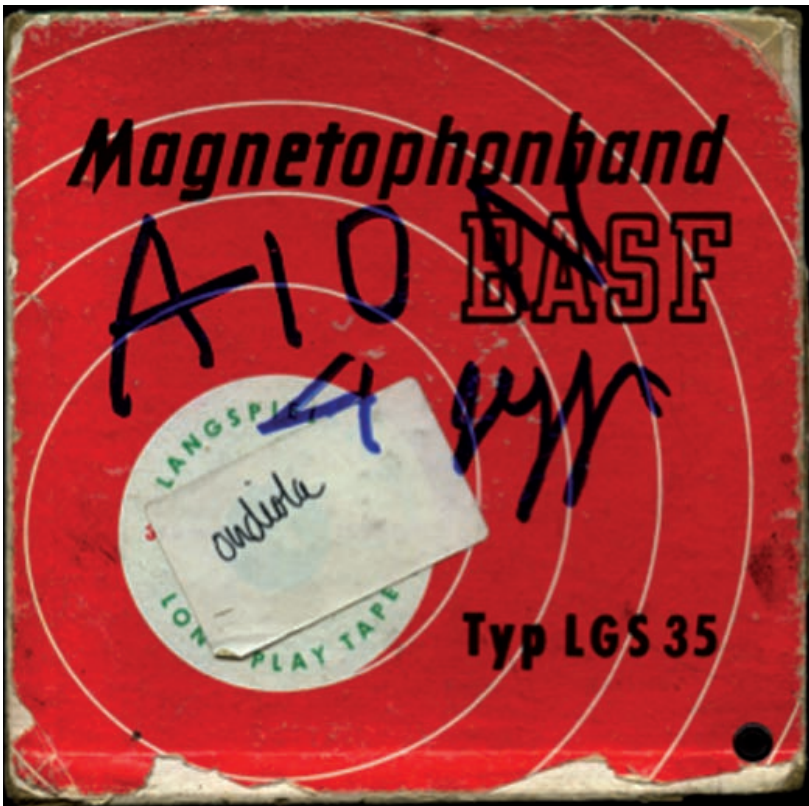
Scatola del nastro NMGS0144-478

Archivio Storico Fondazione Isabella Scelsi. Fondo Giacinto Scelsi